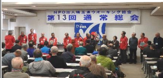
理事会メンバーの紹介